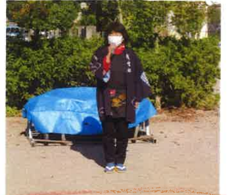
洋子のお話を聞きました