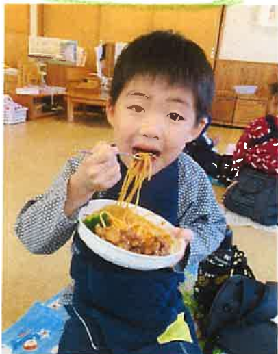
ピョクニツクラニチ