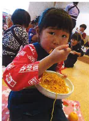
スパゲッティ おいしいよ