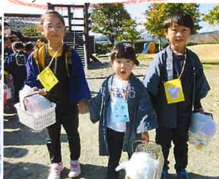
へんの子と(おかり)手をつないでいっ