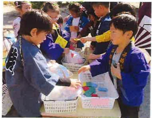
くじひいてくたさい