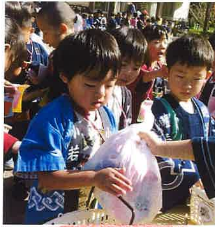
大きなお菓子です