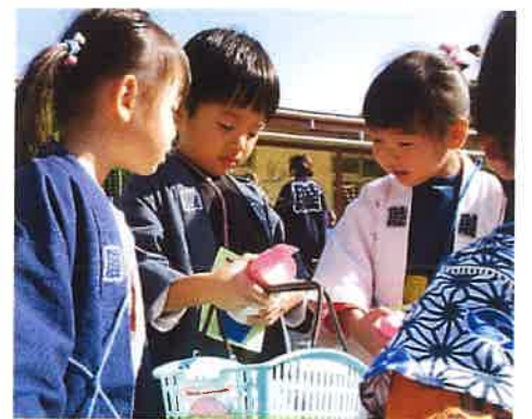
7ばんばんです、7です