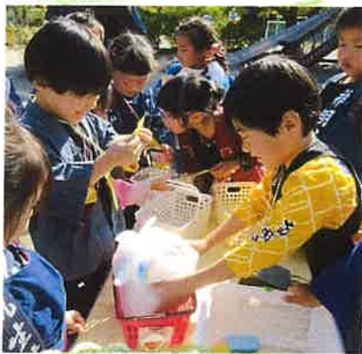
おかしうれしいな