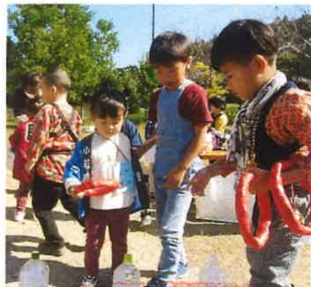
あんとはいるか? と