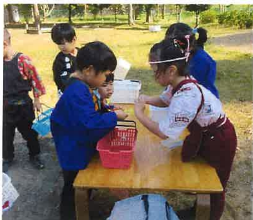
シールはってあげる