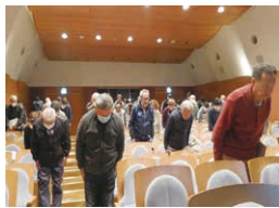
おじぎの実演講習

挨拶にはおじぎが伴います。美しいおじぎは、それだけで丁寧な印象を与えます。言葉を発してから頭を下げる『語先後礼』のおじぎについて、会場では会員が参加して実演講習を行いました。