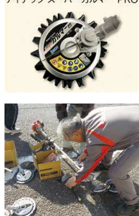
アイデック スーパーカルマー PRO

利用してカルマーを購入された会員の方から『飛び石を心配せず、安心して草刈りができる』と好評です。