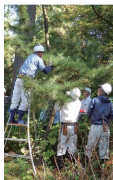
昨年度の講習での実習風景

6/5(水) 会場 沼津御用邸記念公園 定員 15名 内容 剪定の基礎、講義・実習 講師 シルバー会員