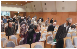
会員も参加したおじぎと電話対応の実演講習

顔の見えない電話での会話は、ちよつとした対応で印象が決まります。「明るく、親切、丁寧」を心掛けることが大切として、会場では会員が参加して電話対応の実演講習を行いました。