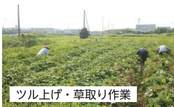
ツル上げ・草取り作業