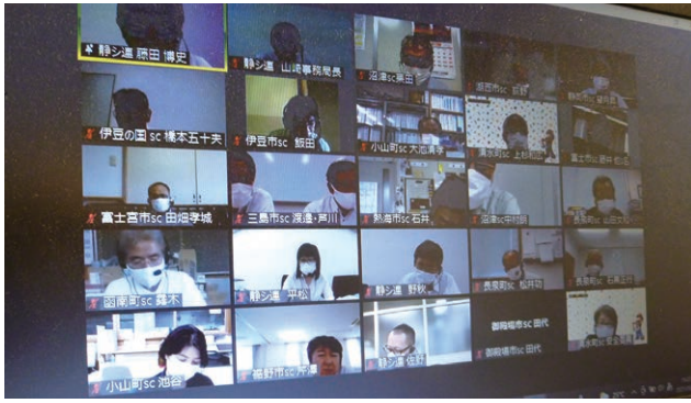
県内東部地区の14拠点より当センター安全管理委員3名を含む計28名が出席

9月7日、静岡県シルバー人材センター連合会主催の「安全・適正就業推進東部研修会」が開催されました。例年、県内の各センターの安全管理委員が一堂に集まり開催されていましたが、コロナ禍の影響により昨年度は開催中止、本年度は県内を4地区に区分し、Web会議システムを利用した開催となりました。