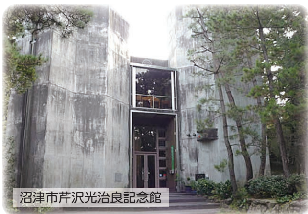
沼津市芹沢光治良記念館

☎055-964-1153・FAX055-964-1156 https://palangel.jp/r2/us/numazu-sjc/ ※右上のQRコードよりHPをご覧ください。 E-mail numazu.sjc@theia.ocn.ne.jp