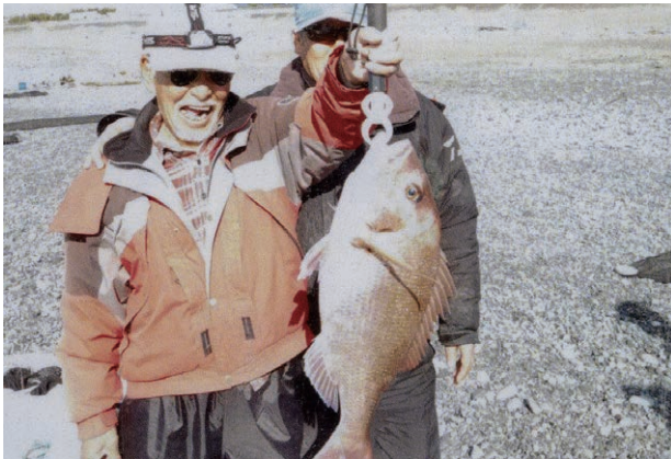
片浜海岸で釣り上げた60cm(5kg)オーバーのマダイ

ゴの付いた仕掛けにウキを装着し、遠投して沖合いに漂わせアタリを待ちます。私のホームグラウンド片浜海岸では、1〜2月はサバ・アジ、3月からはマダイ、ハイシーズンの5〜7月はサバ・ソーダガツオ・カンパチ等の青物、8月〜年末はイナダ・マダイ・メジマグロがメインターゲットになります。これらの獲物を狙い毎日午前4〜11時は釣りの時間になります。ハイシーズンは、この時間に加え午後4〜10時も釣りの時間となります。これがシルバーの仕事がない日の日常です。