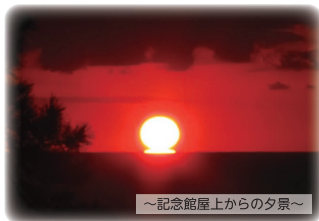
～記念館屋上からの夕景～