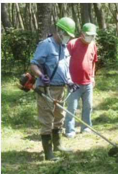
本年5月の講習会での実習風景