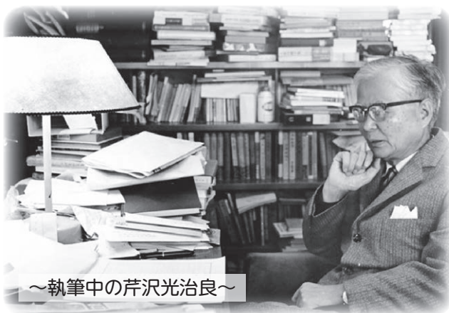
～執筆中の芹沢光治良～