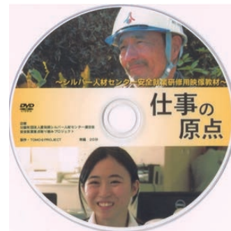
愛知県内のシルバー人材センター連合会がプロジェクトチームを結成し作成

ビデオのあらすじは、一般家庭で剪定作業中に、ヘルメットなしで剪定していた会員が脚立から転落して鉢植えに頭をぶつけ死亡。事故を目撃した家族は、事故のショックで精神障害に、またやと手に入れた家も事故のトラウマから手放すことになり、損害賠償訴訟に発展。ヘルメット着用を呼びかけ、現場確認もしていたシルバー職員は裏切られたとの思いの中、過労で倒れて辞職…というものです。 実際に発生した事故をモチーフに、安全を軽視した会員の事故が多方面に悪影響をあたえることを再認識できる内容になっています。