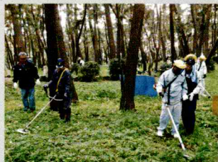
草刈機取扱い講習会