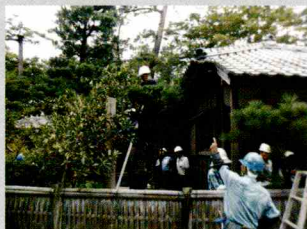
庭園サービス講習会