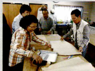
表具サービス講習会