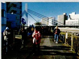
ウォーキング大会