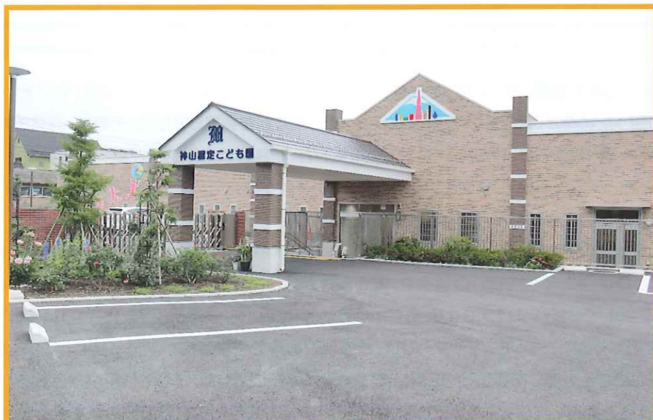
【令和6年4月1日、皆さんの評価を得て、認定こども園の9年目のステージが始まりました。】