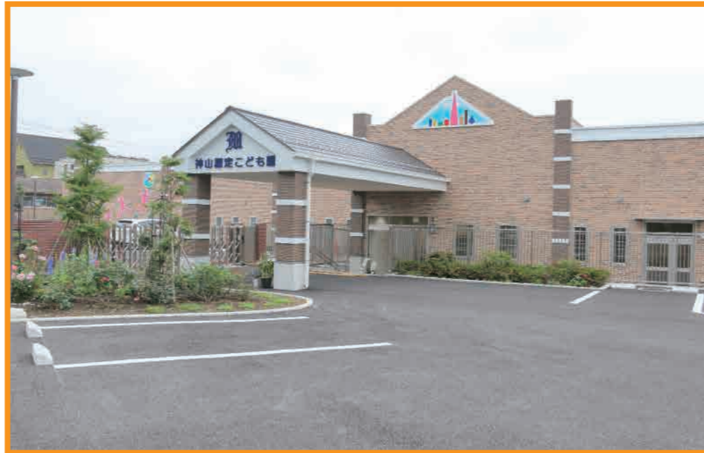
【令和3年4月1日、皆さんの評価を得て、認定こども園の6年目のステージが始まりました。】