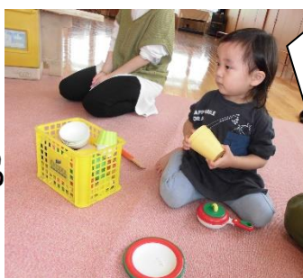
コップに何入れようかな