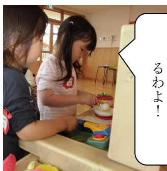
おいしいご飯をつくるわよ！