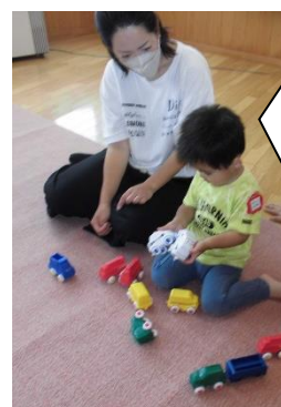
どっちの車で遊ぼうかな？