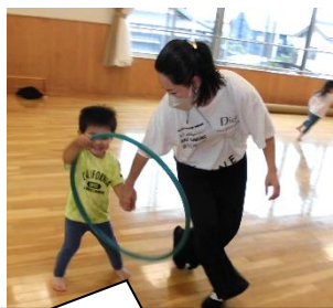
ママと一緒に取れた～