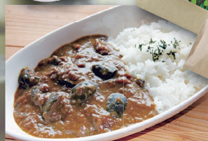
フェイジョアカレー