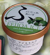
フェイジョアアイス